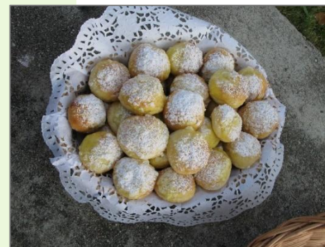
Kralice nad Oslavou, 2008

Sváteční pečivo k požehnání při krojované mši ve farním kostele