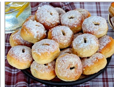
Velká Bíteš, 2021