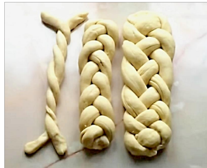
Velká Bíteš, 2016

neboli štědrovnice , po starodávnu také zvané jen „housky“ (húsce) nebo „calty“ – po staletí nezbytná součást vánoční tradice