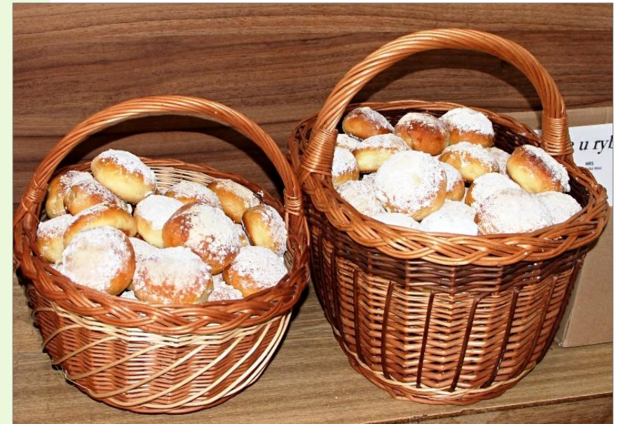
Velká Bíteš, 2021