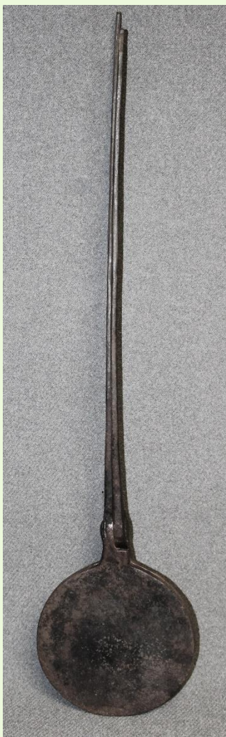
Oplatnice s rytinou – Agnus Dei – Městské muzeum ve Velké Bíteši