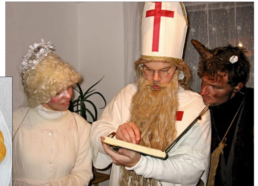
Velká Bíteš, 1983