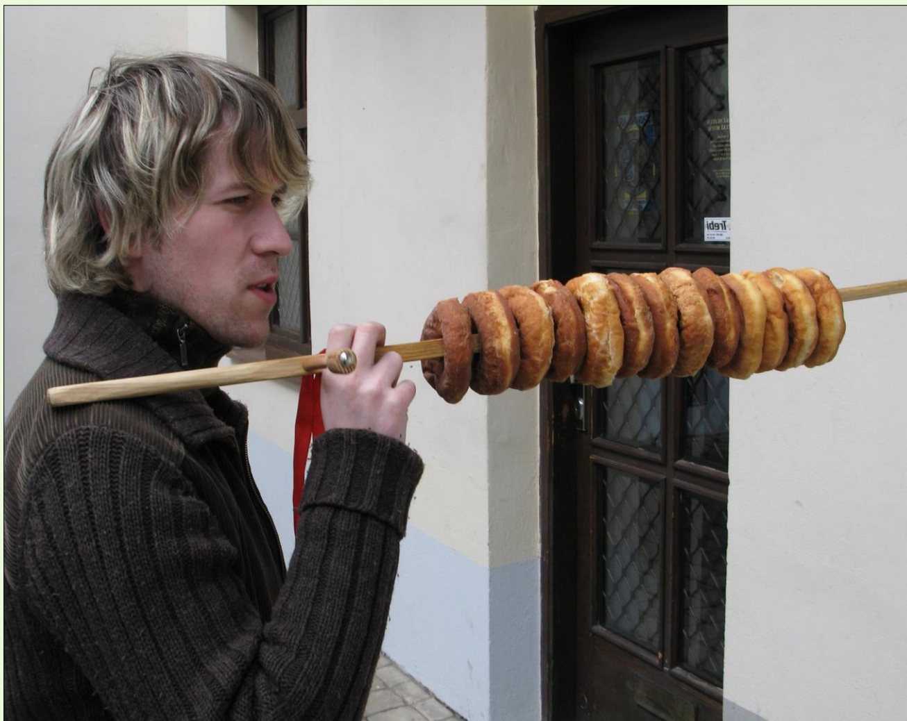
Velká Bíteš, 2008