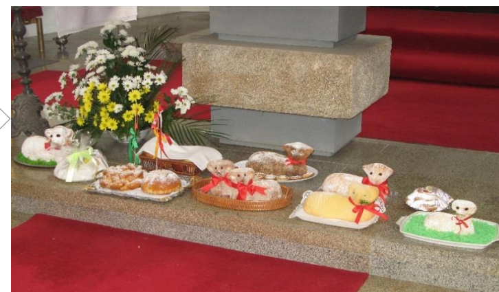
Velká Bíteš, 2008

Magdalena Dobromila Retigová: Dobrá rada slovanským venkovankám