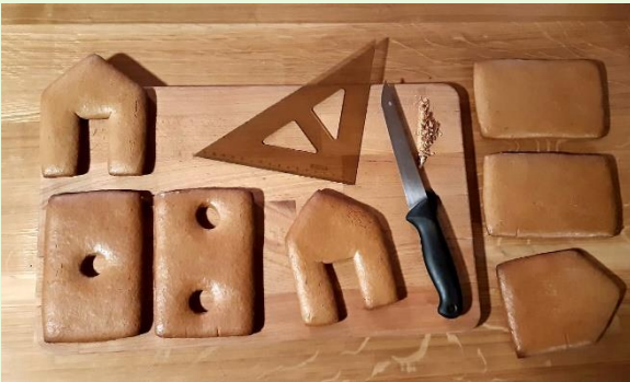
Velká Bíteš, 2020