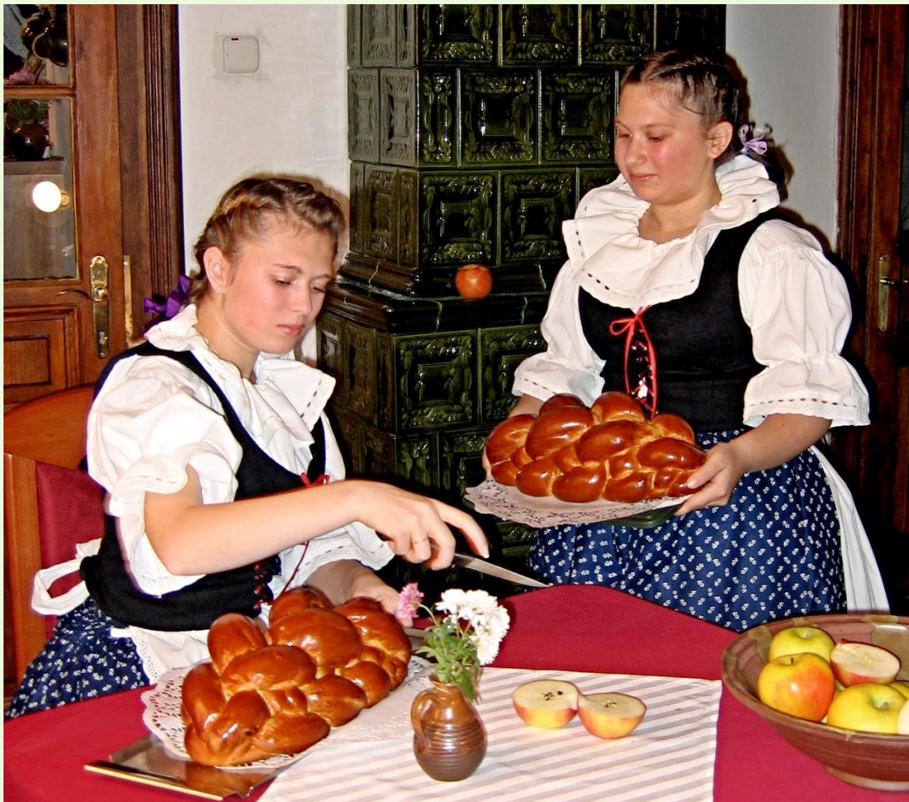
Velká Bíteš, 2005