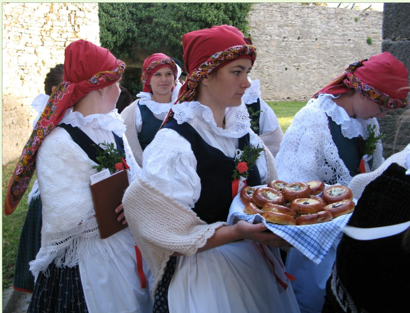
Velká Bíteš, 2008