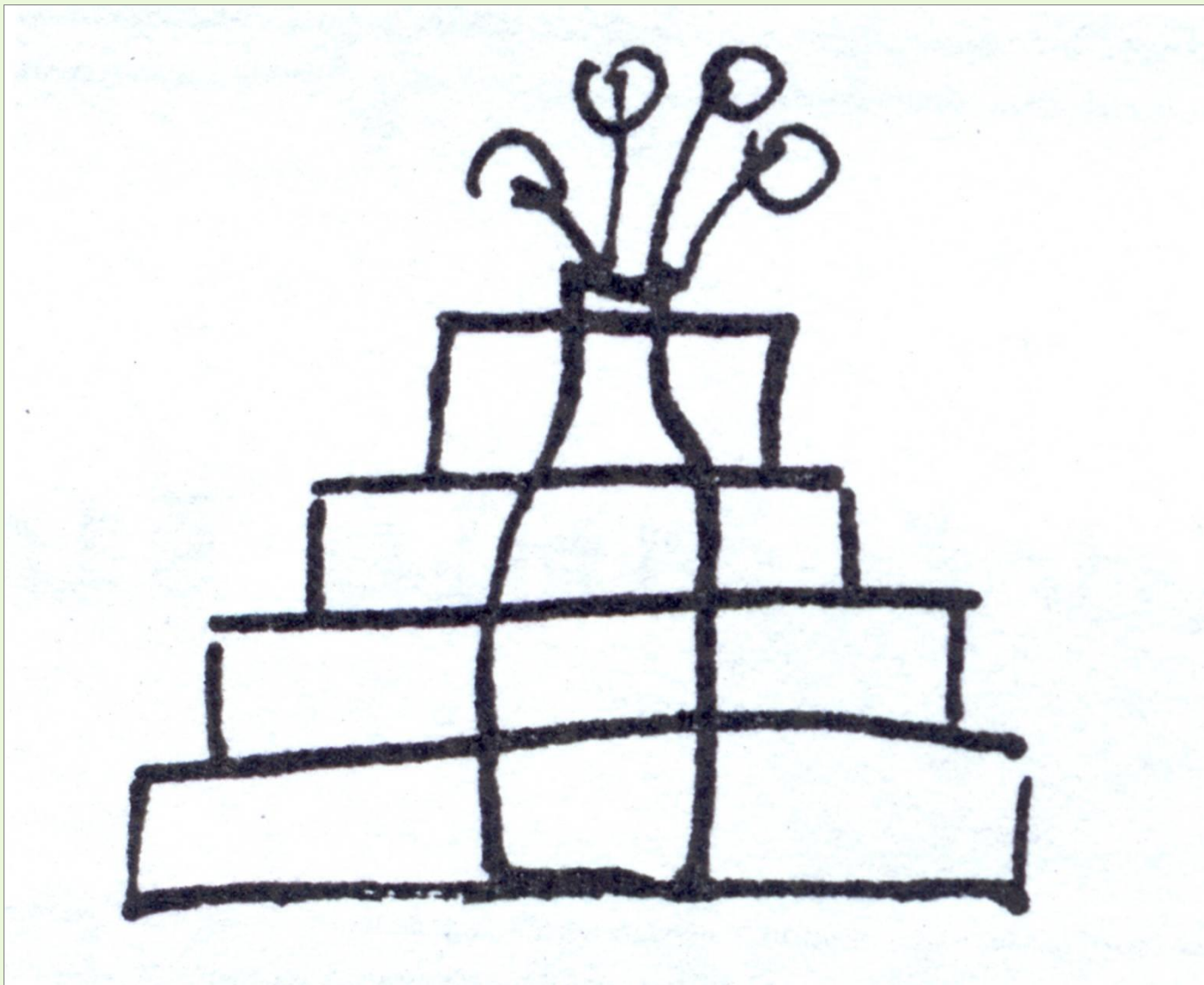
Kresba Zdenka Jelínková