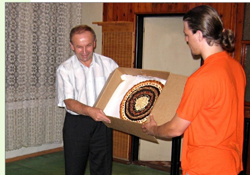
Velká Bíteš – Hanušovce nad Topľou, 2006

Slavnostní předávání velkého zdobeného koláče zástupcem města Velké Bíteše představitelům družebního města na Slovensku.