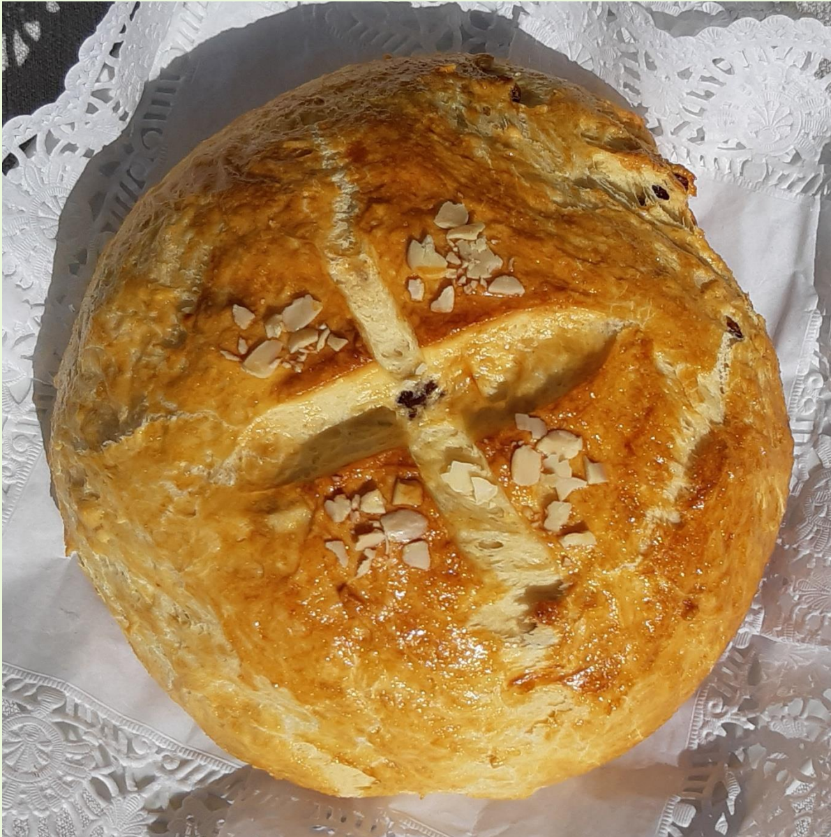
Velká Bíteš, 2020