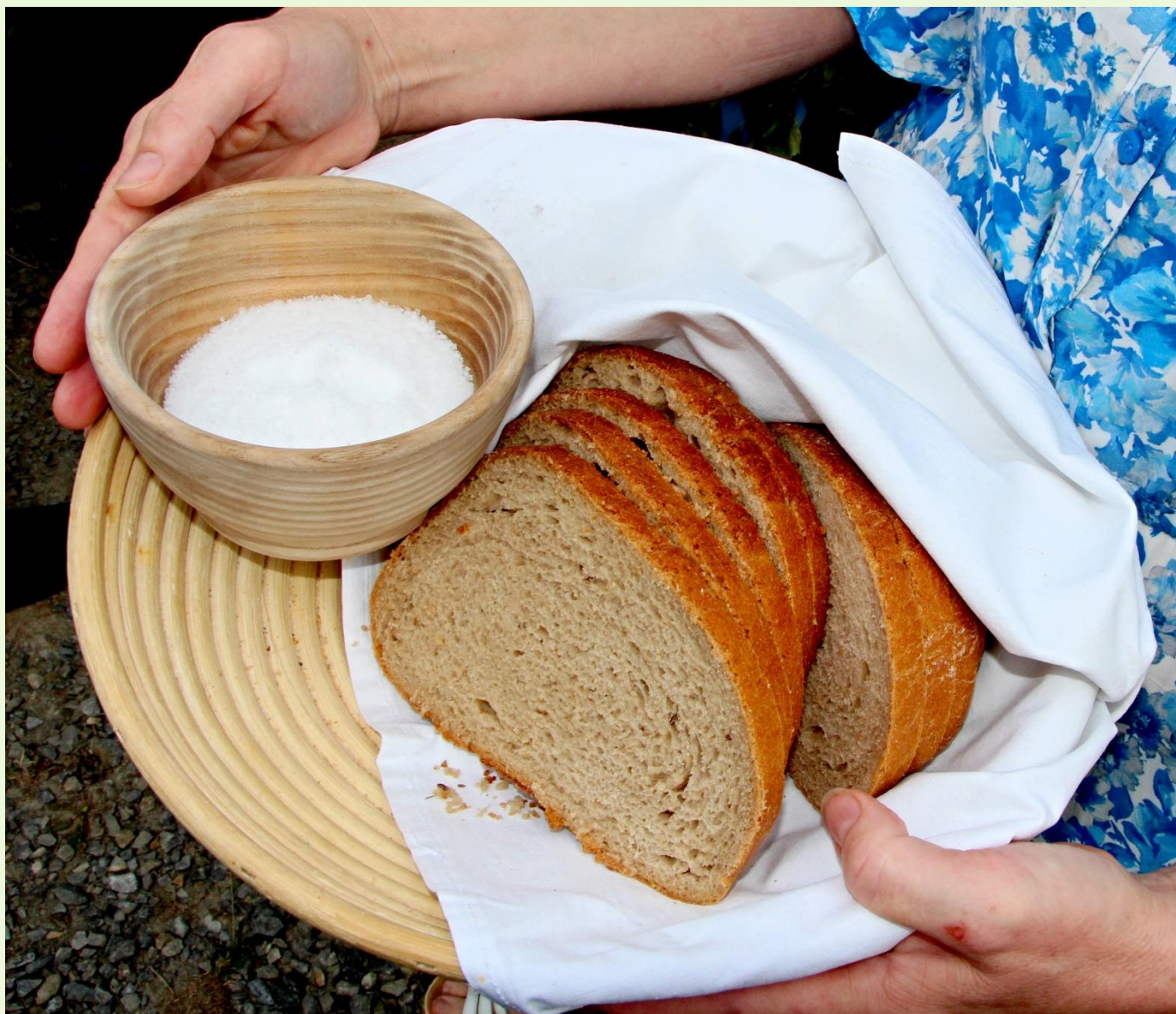
Velká Bíteš, 2021