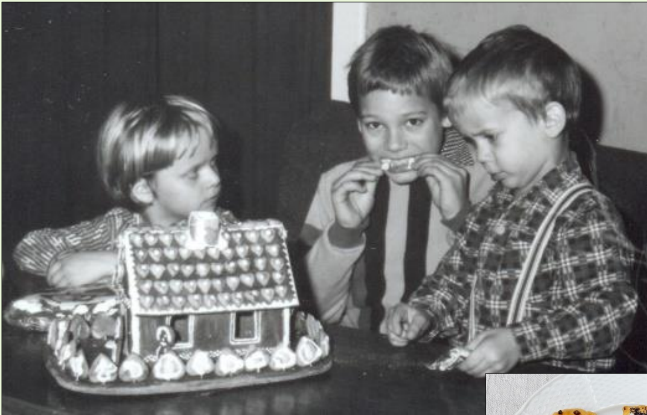
Velká Bíteš, 1983