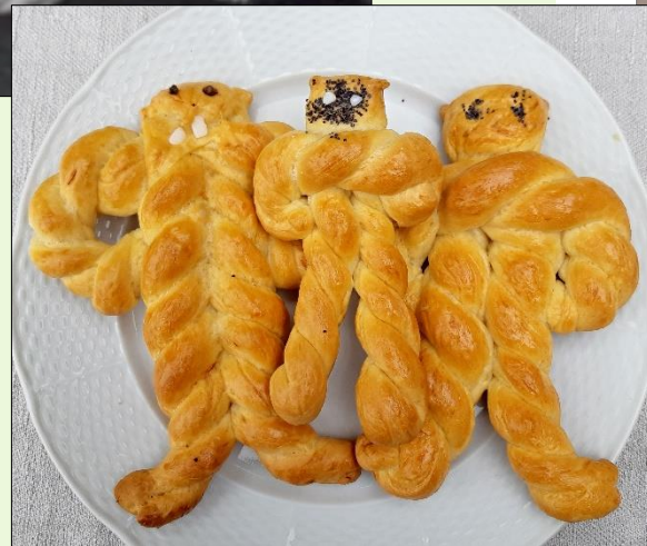
Velká Bíteš, 2021