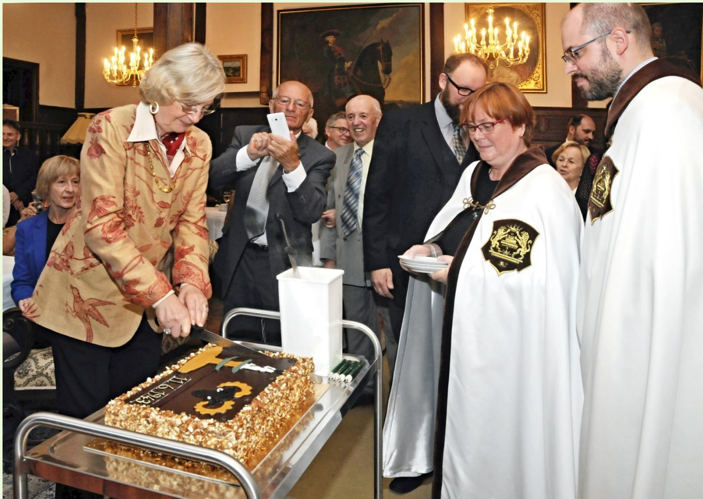
Státní zámek v Náměšti nad Oslavou, 2018