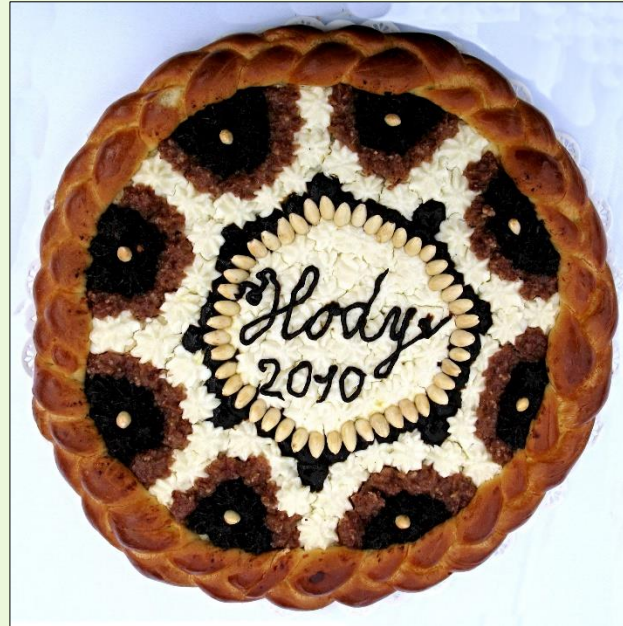
Velká Bíteš, 2010, 2006, 2008