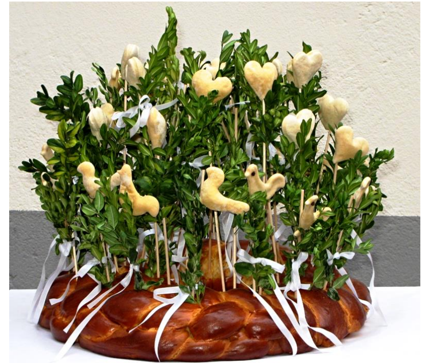
Replika, Velká Bíteš