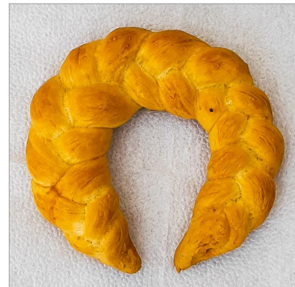
Velká Bíteš 2020