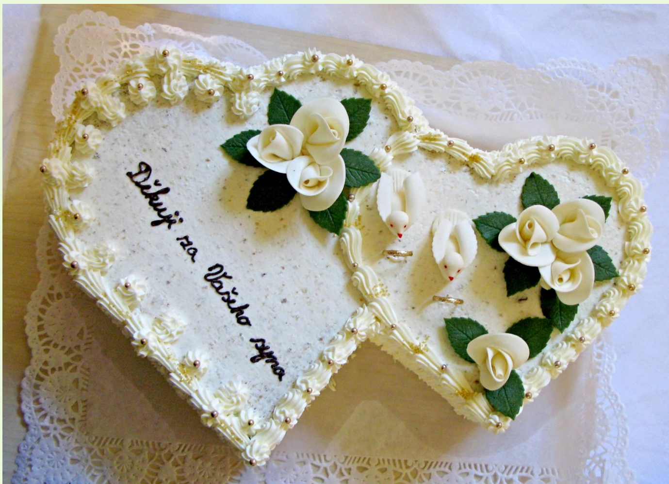
Svatební dort na poděkování rodičům za vychování